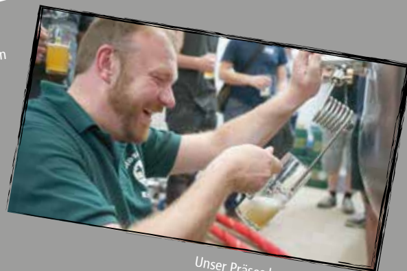
Unser Präses beim Bier zapfen.