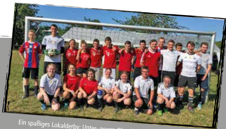
Ein spaßiges Lokalderby: Unter- gegen Oberdorf