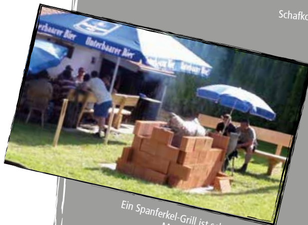
Ein Spanferkel-Grill ist schnell gebaut. Man muss nur wissen wie!