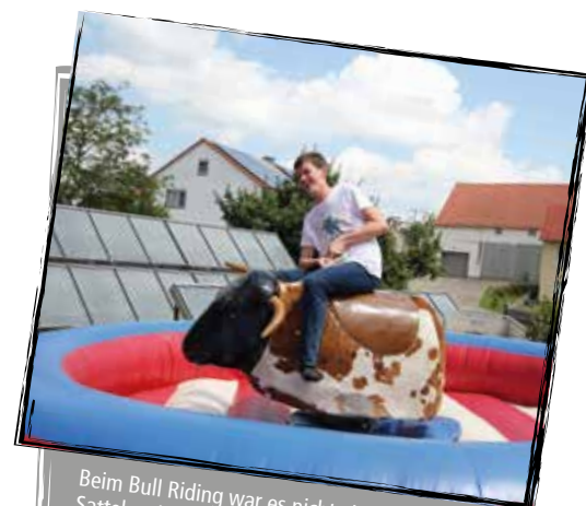
Beim Bull Riding war es nicht einfach, sich im Sattel zu halten.