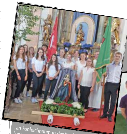
an Fronleichnam in der Kirche mit unsrer geschmückten Maria