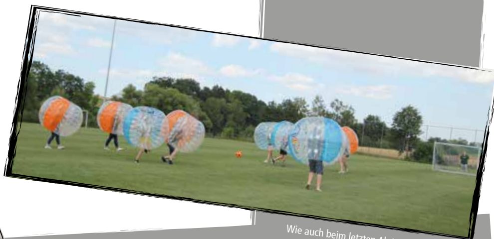
Wie auch beim letzten Aktionstag hatten wir viel Spaß beim Bubble Football.