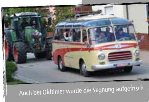
Auch bei Oldtimer wurde die Segnung aufgefrischt

er die Bitte: „Nutzt die Technik, um Gott den Schöpfer zu loben.“ Mit dem Lied „Lobet den Herren“ wurde dann die Segnung eingeleitet, die mit einem Hupkonzert endete.