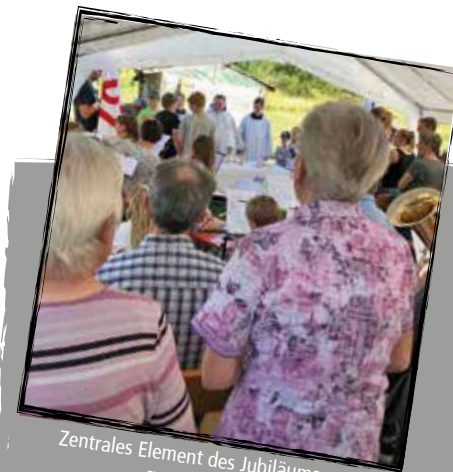
Zentrales Element des Jubiläums war die gemeinsame Gottesdienstfeier.