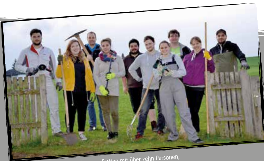
Gut aufgestellt waren wir schon am Freitag mit über zehn Personen, gut bekannt aus den letzten Werkelwochenenden.

Leider stellte sich im Laufe des Tages heraus, dass die Arbeiten am Grillplatz nicht komplett zu schaffen sind. Deswegen haben wir uns entschieden, die Arbeiten an einem anderen Wochenende zu vollenden.