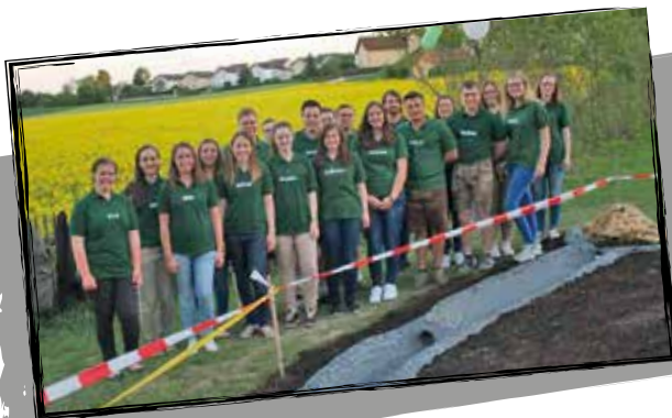
zum Abschluss noch ein Erinnerungsbild mit allen Aktören.