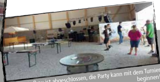
Der Aufbau ist abgeschlossen, die Party kann mit dem Turnier beginnen!