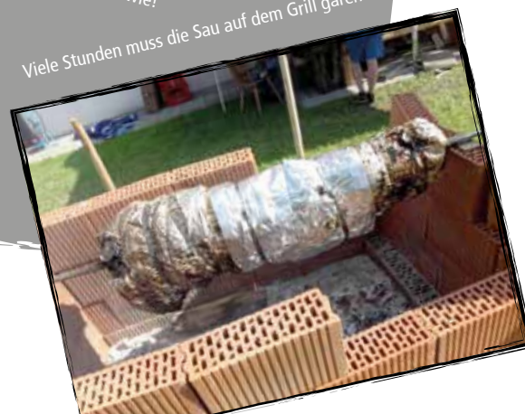
Viele Stunden muss die Sau auf dem Grill garen.