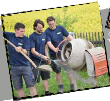
Zur Segnung war auch die Bevölkerung eingeladen.

Dass Beton und Mörtel gelingen, kommt es auf das richtige Mischungsverhältnis an.