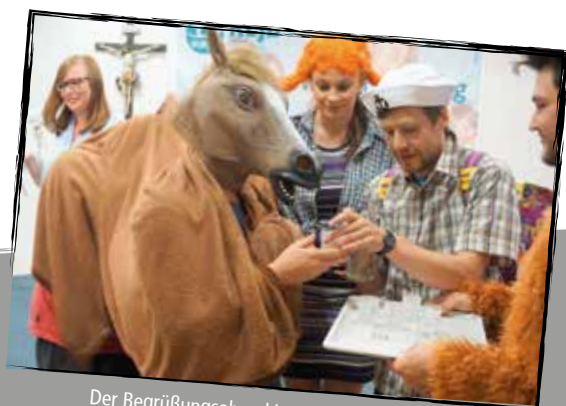
Der Begrüßungsabend bei der Landesversammlung am Volkersberg war eine rauschende Show mit Einlagen aus der Fernsehwelt unserer Kindertage! Danke für alle Beiträge aus den Diözesanverbänden – die KLJB Eichstätt hat dabei gezeigt, was die KLJB-Landesvorsitzenden so spontan können...