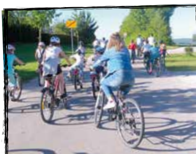
Fahrradtour nach Bergstetten