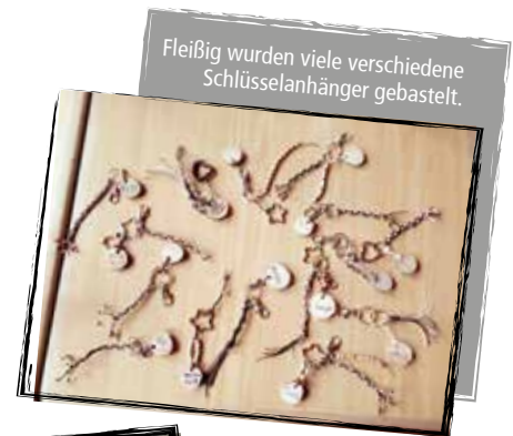
Fleißig wurden viele verschiedene Schlüsselanhänger gebastelt.

Wir blicken auf ein sehr schönes, lustiges, entspanntes und besinnliches Wochenende zurück und freuen uns schon jetzt auf nächstes Jahr.