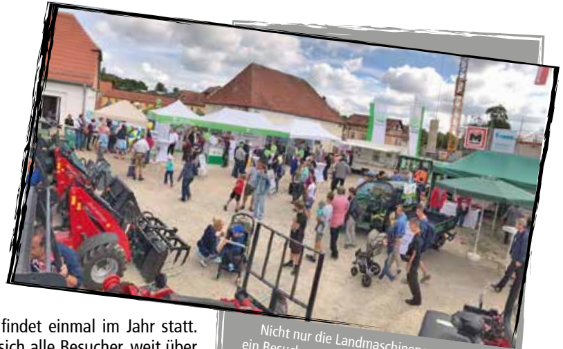
Nicht nur die Landmaschinenausstellung war ein Besuchermagnet - auch der Stand des BBV's mit der KLJB und der BJB war ein Muss für viele Besucher

Das Wetter ließ uns auch heuer nicht im Stich und war genau richtig für einen Besuch in Triesdorf