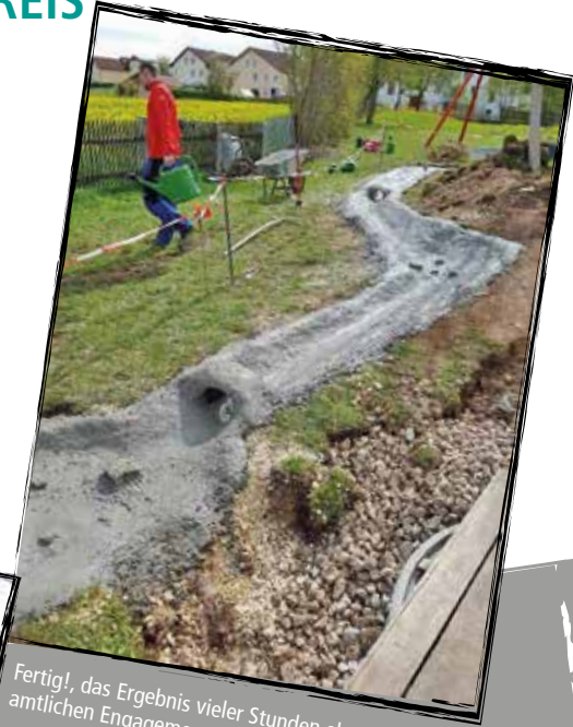
Fertig!, das Ergebnis vieler Stunden ehrenamtlichen Engagement.