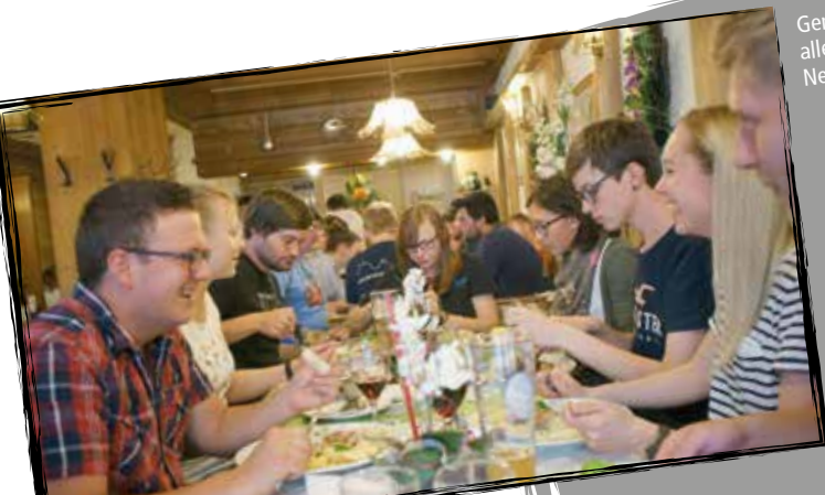
Gemeinsames Mittagessen aller Teilnehmer/innen in Neumarkt.