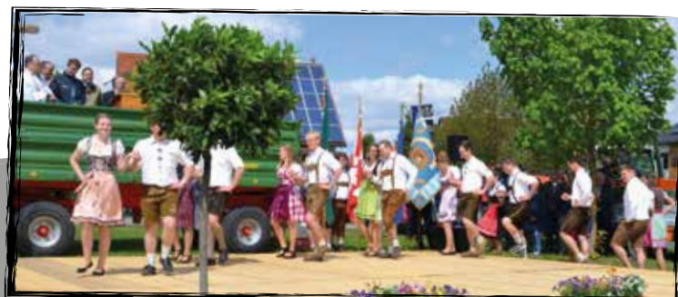
Volkstänzer der KLJB Großenried