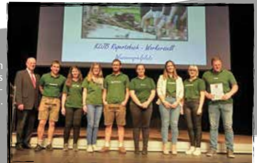
"So seh'n Sieger aus" Herzlichen Glückwunsch zum Jugendpreis des Landkreises Eichstätt in der Kategorie "nachhaltige Projekte".