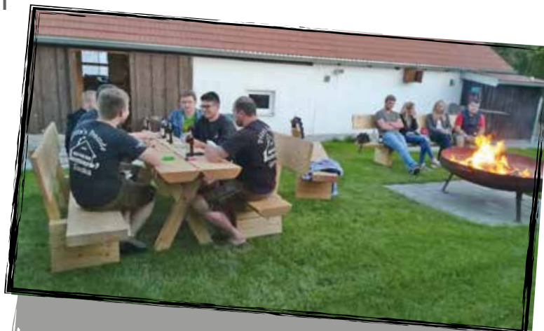
Gepflegte Tradition: Schafkopf in gemütlicher Runde.