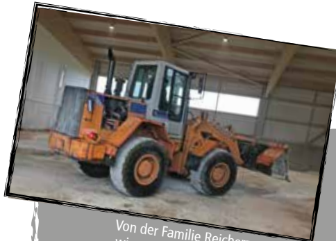
Von der Familie Reicherzer wurden wir auch beim Aufbau mit großem Gerät unterstützt!