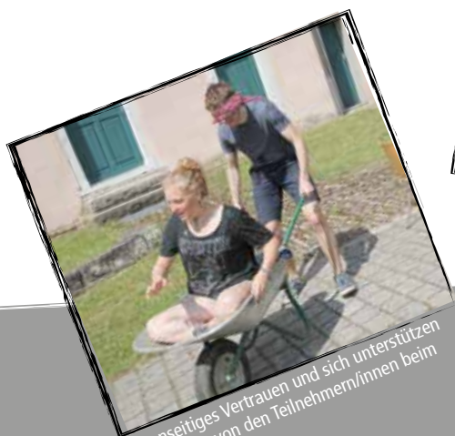
Gegenseitiges Vertrauen und sich unterstützen war gefragt von den Teilnehmern/innen beim Stationenlauf