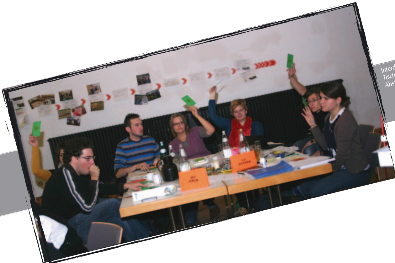
Interdiözesaner Tisch bei der Abstimmung