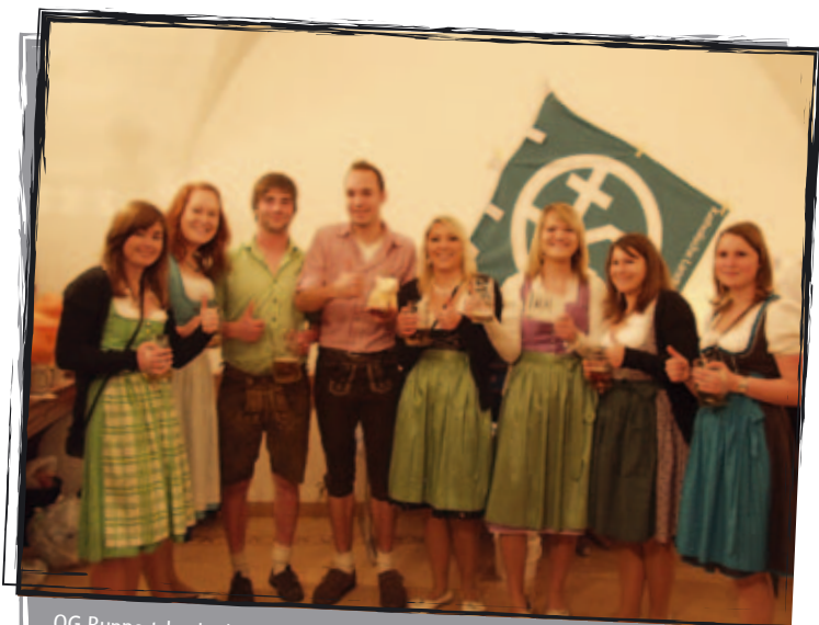
OG Ruppertsbuch als Sieger des Namenswettbewerbs