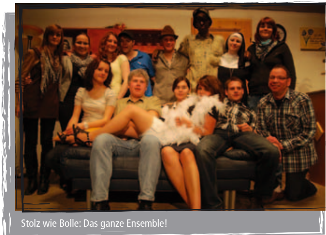
Stolz wie Bolle: Das ganze Ensemble!